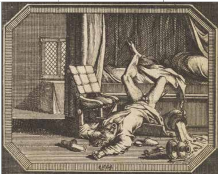
Jan Goeree, Bedrogen vader/ man uit bed gevallen, 1705.